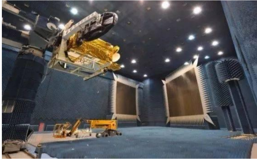
整星（船）级超大EMC实验室