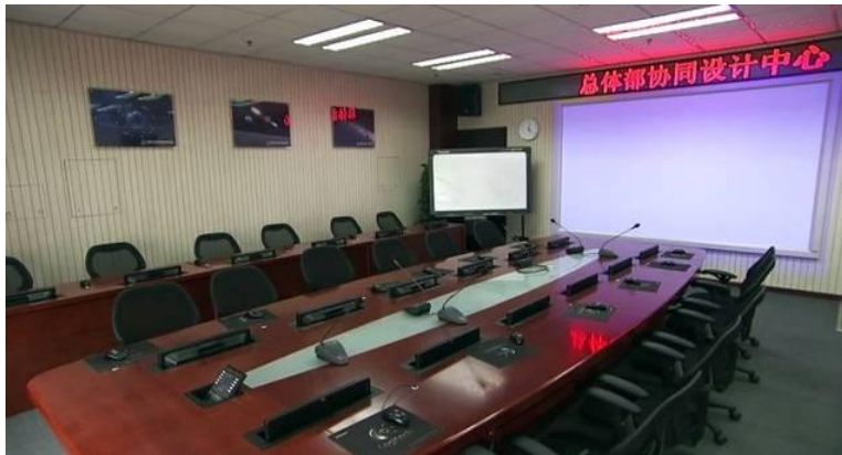
国内卫星数据模型最全的系统设计与仿真实验室